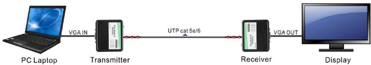
Diagrama de aplicación